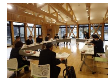
白鷹町視察の様子