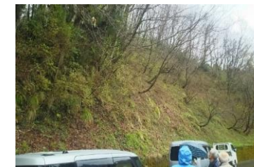
寄付山林の確認の様子