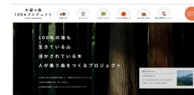
HPのトップページの様子