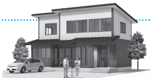
学園団地住宅の完成予想図