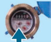
銀色のコマ 水道水を使用すると回転

水道の蛇口を全部閉めてから、水道メーターの銀色のコマを見てください。コマが回っていると漏水しています。